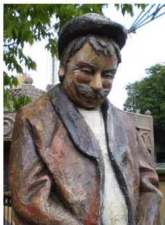
Personnage - 2 couches Acrystal Finition - Prater - Vienne - Roland Zojer (Fasching)

ATTENTION: L'Acrystal Prima supporte les intempéries, mais ne peut en aucun cas être immergé ou aspergé en permanence. En cas un contact prolongé avec de l'eau vous pouvez soit: