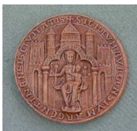
Sceau - Marc Toillié

Pour le moulage de pièces à sections très fines (quelques millimètres), il est possible de passer le ratio de mélange de l'Acrystal Prima de 1 pour 2,5 à: