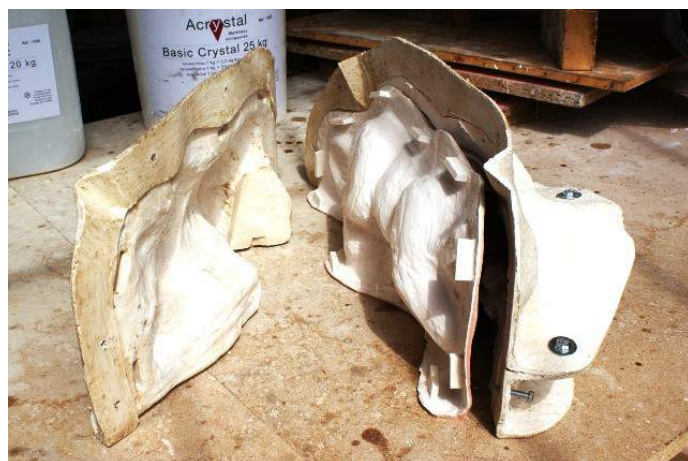
Chape de moule fine - Frédéric Vincent

L'Acrystal Prima est le produit idéal pour la réalisation de chapes de moules légères. L'absence de retrait évite les déformations de la chape au séchage. Même pour des chapes de grandes dimensions les renforts métalliques sont inutiles.