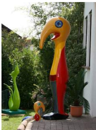
Haptikuss - 2 couches de peintures acryliques + 2 couches de vernis acrylique brillant - Silvia Baumer

ATTENTION: N'appliquer les produits de finition que sur des produits parfaitement secs (minimum 72 heures de séchage) afin d'éviter les problèmes de cloques.